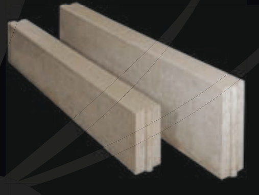
100x20x10 & 100x30x10 grijs