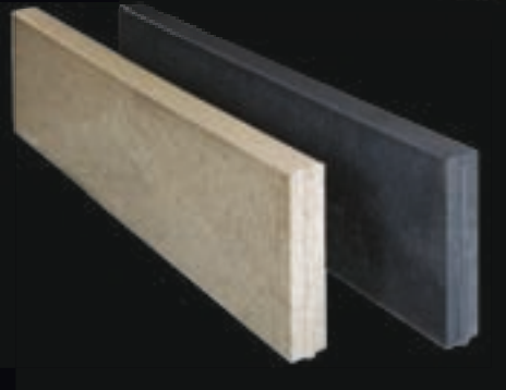
100x30x6 grijs & antraciet