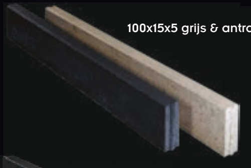
100x15x5 grijs & antraciet

Boordstenen zorgen ervoor dat uw klinkers na verloop van tijd niet kunnen wegschuiven. Ze worden meestal gelijk of iets lager dan de bovenzijde van de klinkers geplaatst, zodat u er maar weinig van ziet. Ze kunnen eveneens worden gebruikt om een beperkt hoogteverschil op te vangen.